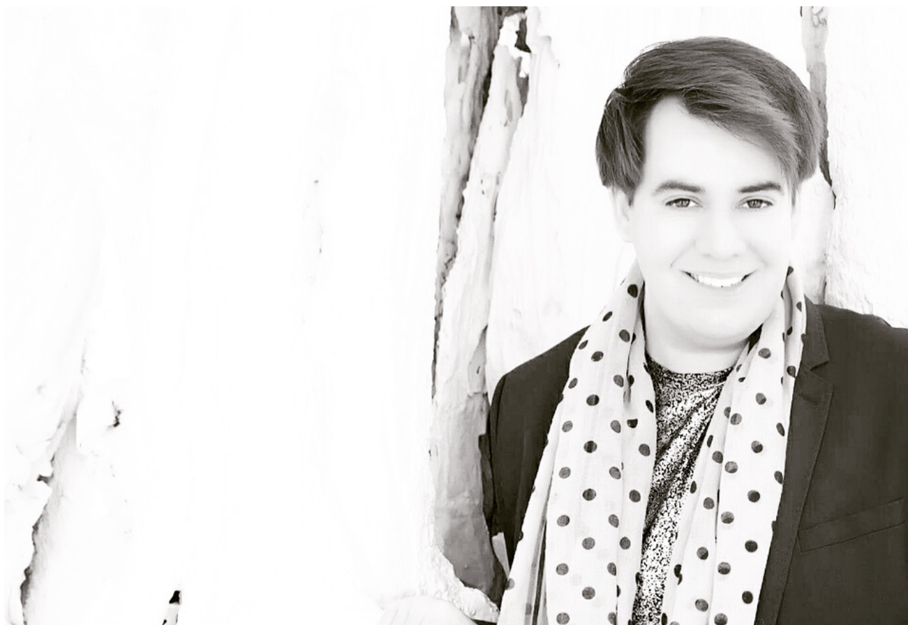
ANTOINE FORTIER ARTISTE LYRIQUE - COMÉDIEN